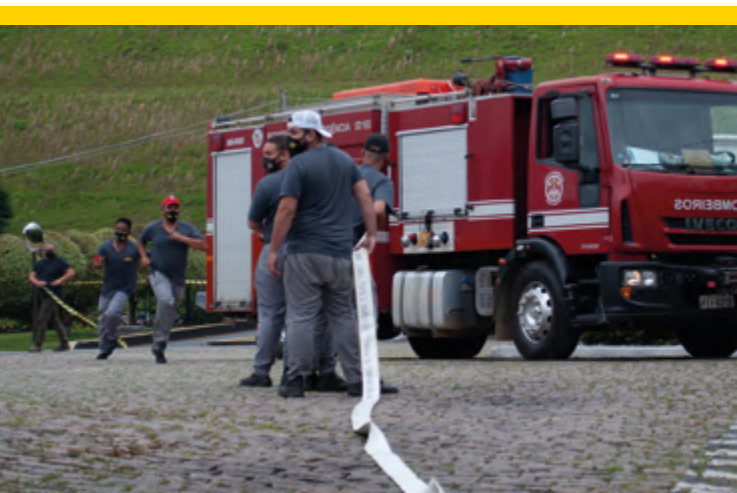
Simulado do Plano de Emergência - Brigada de Incêndio da Promax

Certificados: os colaboradores que finalizam os cursos recebem certificados de conclusão.