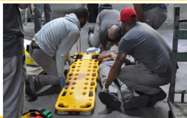
Simulado do Plano de Emergência - Brigada de Incêndio da Promax

Em 2023 e 2024, a empresa não registrou nenhum caso de doença ocupacional. A gestão e monitoramento das condições de saúde relacionadas ao trabalho são conduzidos anualmente, em parceria com uma clínica especializada, responsável pela realização dos exames exigidos pelo Programa de Controle Médico de Saúde Ocupacional (PCMSO). Além disso, a Promax mantém um controle rigoroso sobre o uso dos Equipamentos de Proteção Individual (EPIs), garantindo a prevenção efetiva de acidentes. [GRI 403-10]